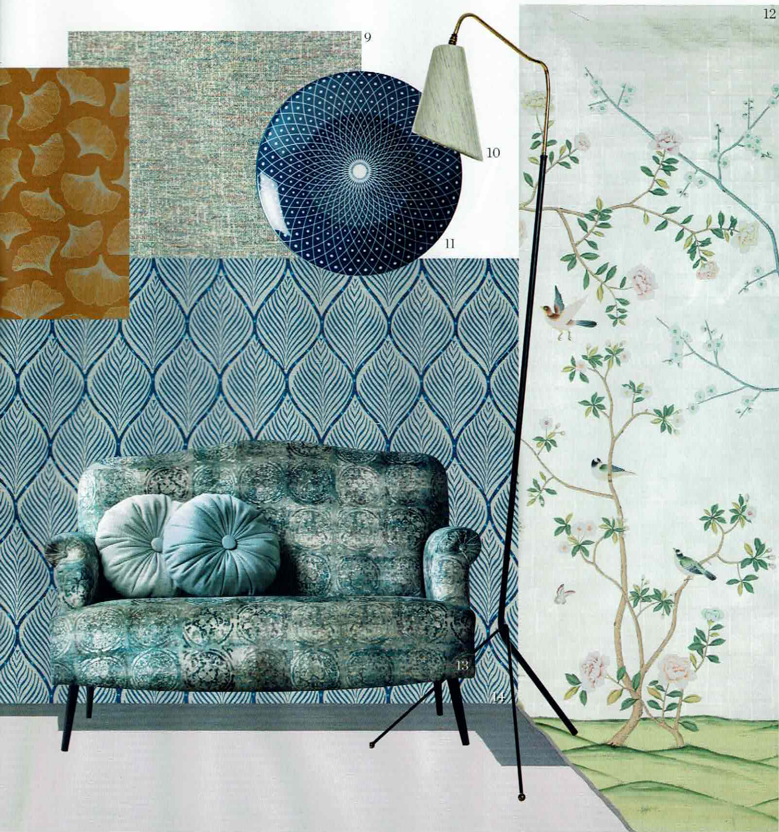
9. Efecto Chanel. Tejido semilliso Joseph , del catálogo Amadeus , 62 €/m, lo edita la firma textil Güell-Lamadrid. 10. Mid-century. Lámpara de pie Tripode , procedente de Francia y fechada en la década de los cincuenta, 175 €, en la tienda La Recova. 11. Vajilla. En azul índigo, es de la colección Japan , a partir de 3,50 €, en Casa Viva. 12. Sobre seda. Papel pintado a mano, Badmington Chinossérie , desde 800 €, el panel de 91,5 cm de ancho, editado por encargo por la firma francesa De Gournay. 13. Sofá. Está tapizado con el terciopelo suave de algodón Talento , 125,90 €/m, en 1,40 m de ancho, y los cojines se han confeccionado con la tela jacquard Arezza , de hilos gruesos tintados, 75,50 €/m, en 1,40 m de ancho. Todo de la firma de tejidos Alhambra, a la venta en Pepe Peñalver. 14. Un print muy japonés. Tela modelo Bonelles , de Nina Campbell, 137 €/m, distribuida por Osborne & Little.